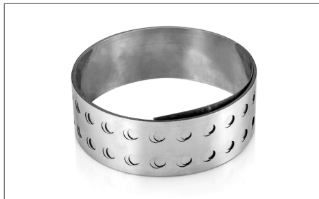
Бандаж для машины CG2-11L

При применении машины CG2-11L для резки труб диаметром более 600 мм, необходимо применять бандажи следующего размера: